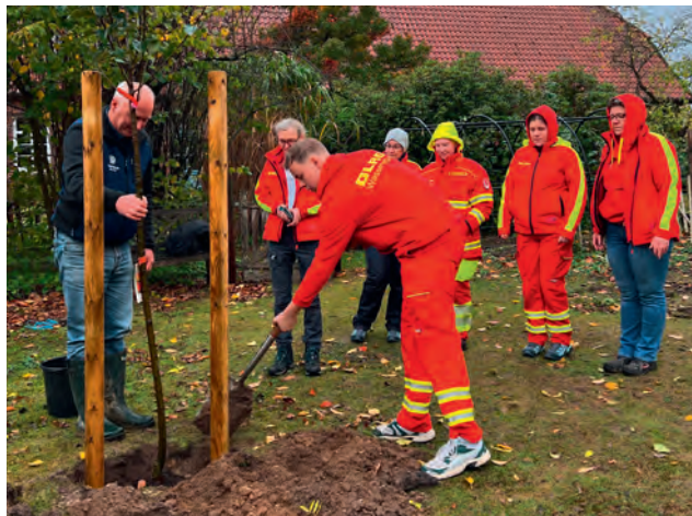
Mitglieder der OG Stadensen pflanzen einen Apfelbaum

Schon geraume Zeit kursiert in den Sozialen Medien die sogenannte Baumpflanz-Challenge und animiert Vereine, Gruppen oder Betriebe dazu, innerhalb einer bestimmten Frist einen Baum zu pflanzen .