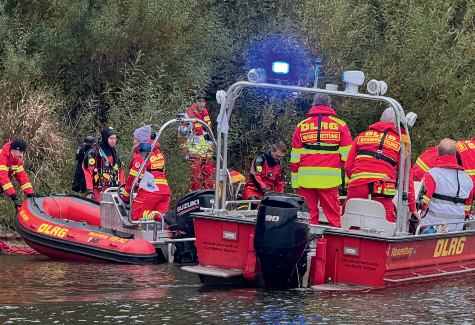
Die Einsatzkräfte in voller Montur bei einer Einsatzübung vom Bezirk Aller-Oste.