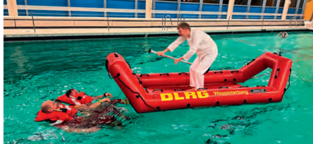
Eisretter im Hallenbad.

D er neue Eisretter 14H1 der Firma mission-craft, der im Frühjahr 2025 dank Fördergeldern angeschafft werden konnte, sollte rechtzeitig vor seiner ersten »echten« Saison ausgiebig getestet werden. Und wo lässt sich der Umgang mit einem neuen Rettungsgerät stressfrei erlernen? Im warmen Hallenbad. So fand im Dezember ein spezieller Trainingsabend statt, bei dem die Einsatzkräfte den Umgang mit dem Eisretter