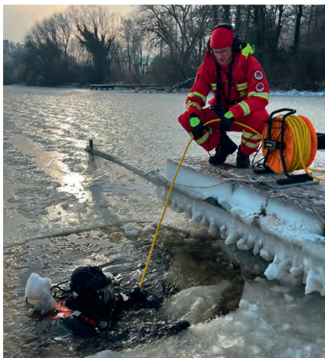
Die Taucher sind über die Telefonleine verbunden.

An einem kalten Winterwochenende war das Zwischenahner Meer erstmalig zugefroren. Nur einige wenige Flächen waren noch eisfrei. Daher entschlossen sich die Tauchgruppen der DLRG Bockhorn-Zetel und der hiesigen DLRG, kurzfristig einen Eistauchgang im Zwischenahner Meer anzusetzen. Für Spaziergänger und Schlittschuhläufer war das Eis noch nicht tragfähig genug (15 bis 20 cm).