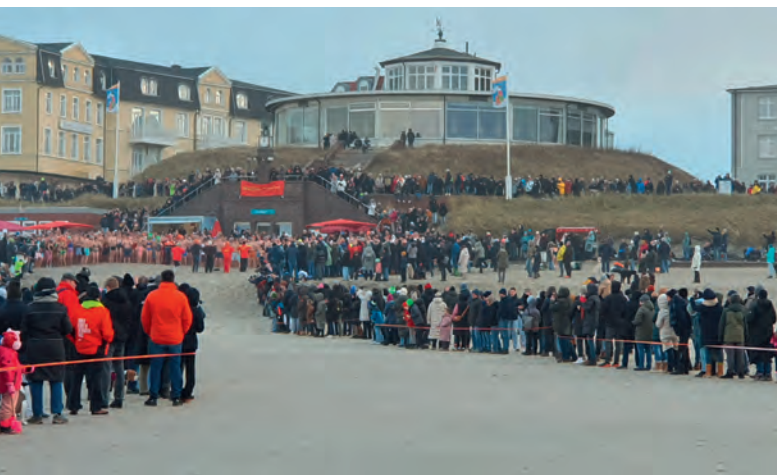
Der Weg der Schwimmer: 371 Teilnehmer bei der Aufwärmrunde. Rund 1.500 Zuschauer säumen den Strand und die Promenaden.