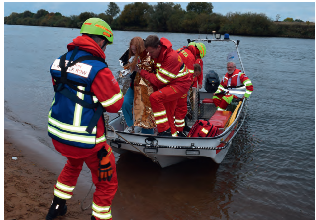
Zur Übung gehörte auch die medizinische Erstversorgung der Mimen.

Der Einsatzzug des Bezirks sammelte sich an der A27 und verlegte von dort ins betroffene Gebiet an der Weser. Diverse Boote der Wasserrettungs- und Tauchstaffeln slippten an einem Fähranleger und arbeiteten das Szenario ab. Dank der Mimen konnten sie die Erstversorgung und den Transport von Verletzten trainieren. In deren Repertoire waren neben mobilitätseinschränkenden Verletzungen auch Verbrennungen und